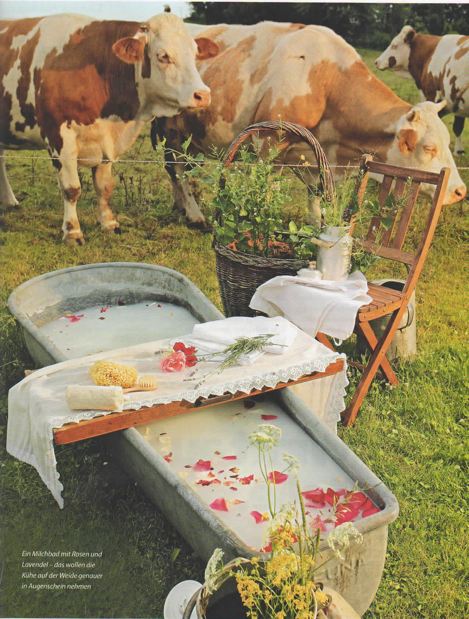
Ein Milchbad mit Rosen und Lavendel – das wollen die Kühe auf der Weide genauer in Augenschein nehmen